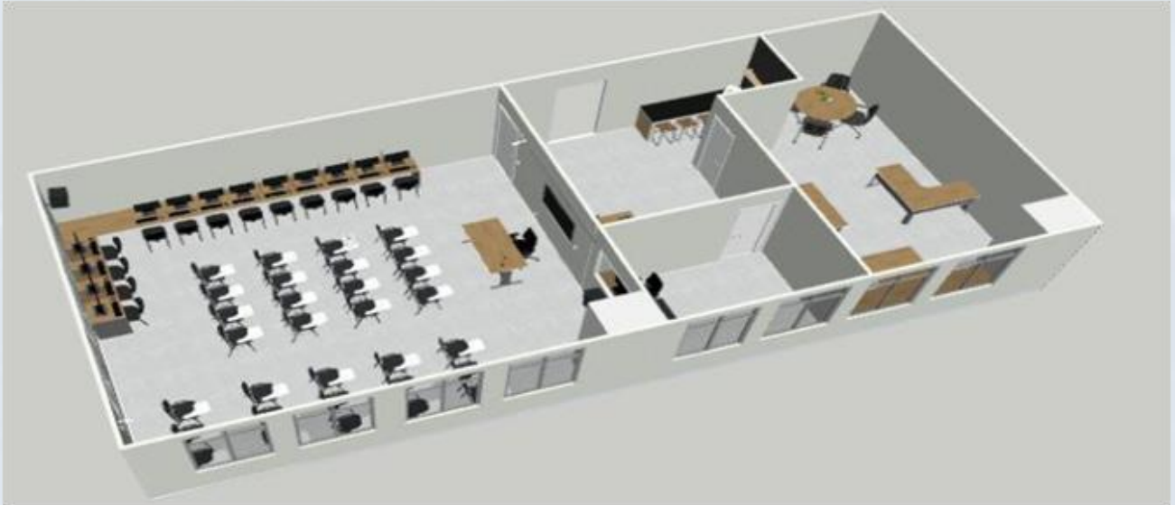
Figura 1 – Planta Baixa da ESCI e Projeto Executivo

A ESCI acompanhará o processo de reforma e modernização das instalações físicas, com o apoio da Diretoria Geral de Administração e Finanças – DGAF da CGE-RJ.